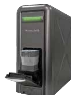
Insérer la cartouche