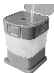
Insérer l'échantillon et fermer la cartouche