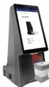
Scanner la cartouche